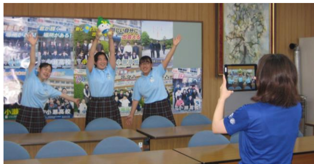
パラオブルーサポーターがメッセージ動画を撮影しました