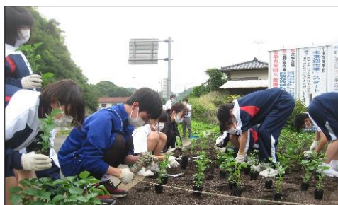
サルビアの苗の定植(6月)