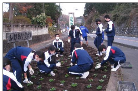
ビオラの苗の定植(12月)