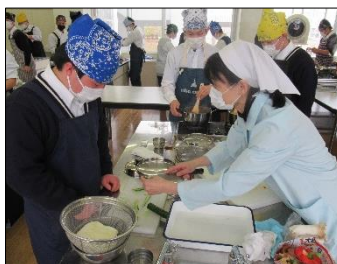
真剣な表情で実習に取り組んでいます