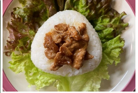
生徒の作成した梅の入ったおにぎりや肉をのせたおにぎり