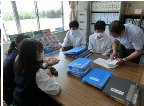
各種委員会の様子