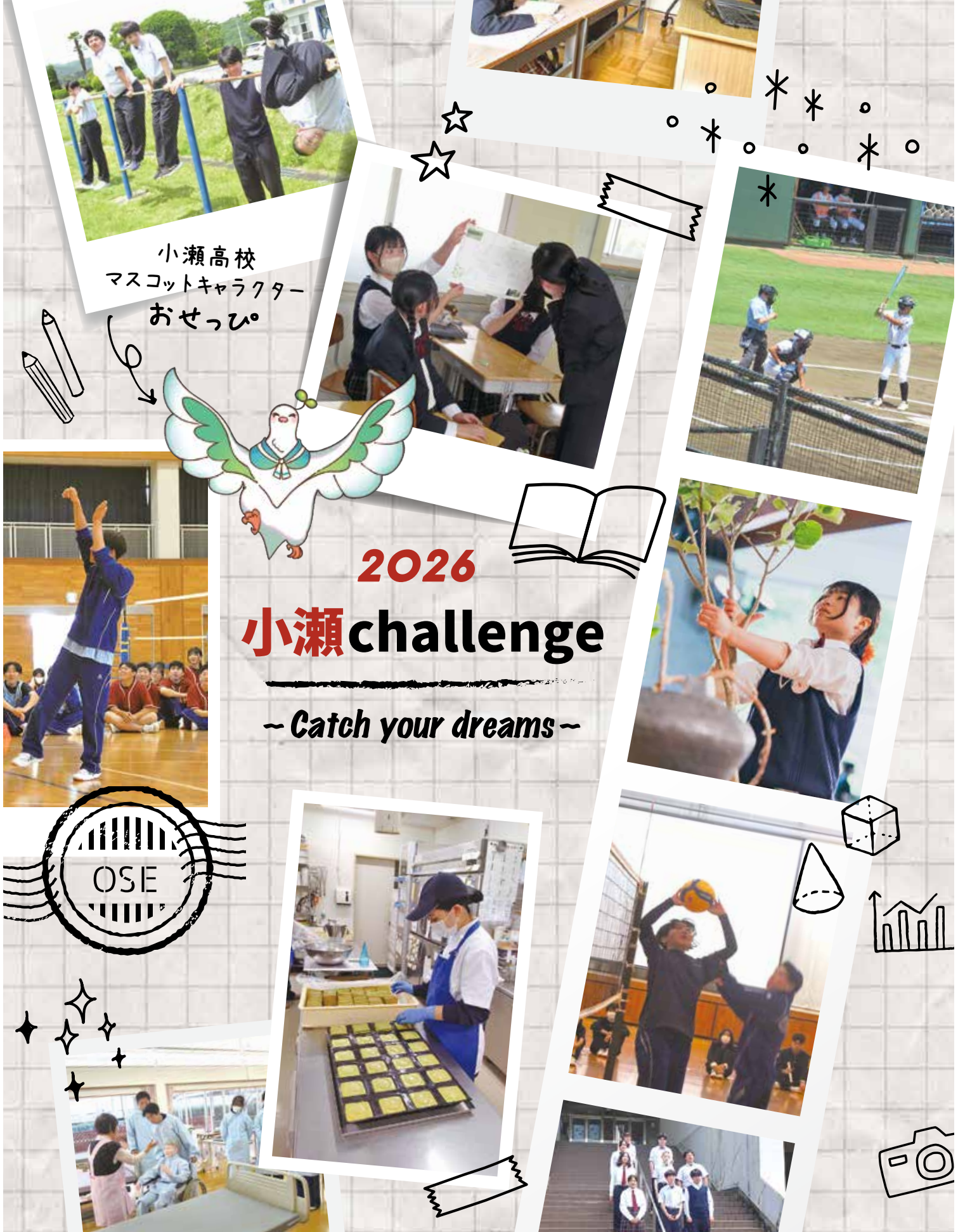
小瀬高校 マスコットキャラクター おせっぴ