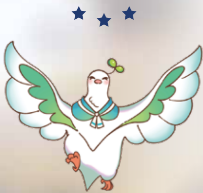
小瀬高校マスコットキャラクター おせっぴ 制作/小林千恵理 (明峰中学校出身)

進路希望に応じた指導、徹底した面接指導、生徒に応じた課外指導、さまざまな資格取得、インターシップ、介護施設での実践実習など、個々の生徒に応じた支援を行っています。その結果、毎年高い水準の進路実現率をあげています。